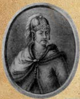
Олег Святославич (Тореславич) - князь (1053 - III кв. в.)

Великий русский поэт, драматург и прозаик. Один из самых авторитетных литературных деятелей первой трети XIX века. Ещё при жизни Пушкина сложилась его репутация величайшего национального русского поэта. Пушкин рассматривается как основоположник современного русского литературного языка.