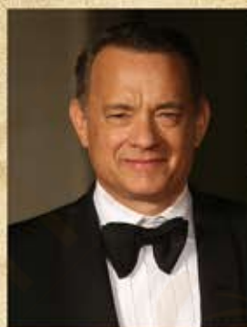
Том Хэнкс - актер (9 июля 1956 г.)

Американский актёр, продюсер, режиссёр, сценарист и писатель. Хэнкс начинал свою актёрскую карьеру с ролей на телевидении и комедийных фильмов, прежде чем добился признания в качестве актёра, и получил две премии «Оскар» в категории «Лучшая мужская роль» — за главные роли в фильмах «Филадельфия» (1993) и «Форрест Гамп» (1994).