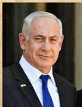
Биньямин Нетаньяху - политик 21 октября 1949 г.

Советский и российский киноактёр, кинорежиссёр, сценарист, продюсер, художественный руководитель Центра театра и кино под руководством Н. С. Михалкова. Герой Труда Российской Федерации (2020), народный артист РСФСР (1984), трёхкратный лауреат Государственной премии РФ и премии Ленинского комсомола.