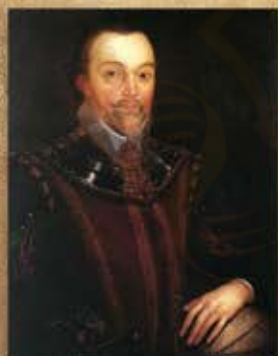
Фрэнсис Дрейк - мореплаватель (1540 - 1596 гг.)

Князь Волынский (1073–1078), Тмутараканский (с 1083), Черниговский (1094, 1097), Новгород-Северский (1097–1115). Четвёртый сын князя Святослава Ярославича от первого брака. Его потомки в летописях именуются Ольговичами.