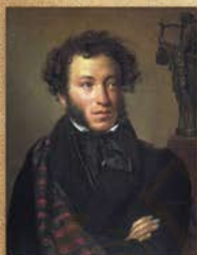
Пушкин Александр - поэт (1799 - 1837 гг.)

Великий русский поэт, драматург и прозаик. Один из самых авторитетных литературных деятелей первой трети XIX века. Ещё при жизни Пушкина сложилась его репутация величайшего национального русского поэта. Пушкин рассматривается как основоположник современного русского литературного языка.